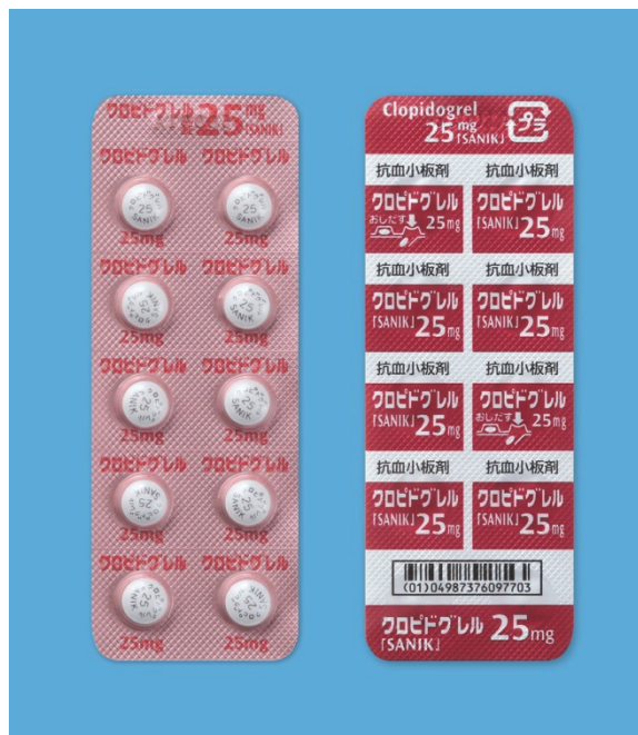
【クロピドグレル錠 25mg 「SANIK」】