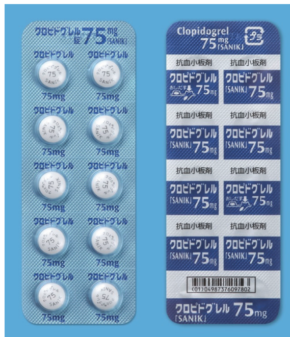
【クロピドグレル錠 75mg 「SANIK」】