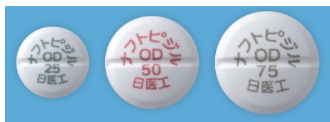
【ナフトピジル OD錠 25mg/50mg/75mg「日医工」】