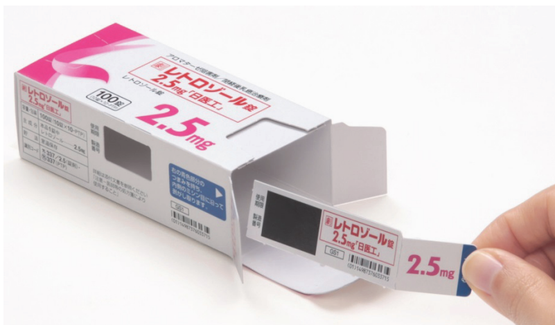
【レトロゾール錠 2.5mg「日医工」】