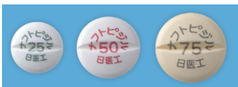
【ナフトピジル錠 25mg/50mg/75mg「日医工」】

これは、安全性が確認されているインクを調合し、数多くの印字の色を開発した結果可能となりました。さらに、安定性を確認したのちに、規格別カラー印字の錠剤が完成します。本剤は、カンデサルタン錠に次ぐ2製品目の規格別カラー印字を施した製品となります。