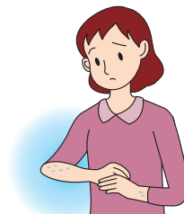
破れやすい水ぶくれ が多発

これら以外にも気になる症状がありましたら、主治医または薬剤師に相談してください。