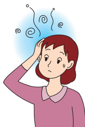
突然の意識の低下