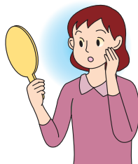
白目が黄色くなる