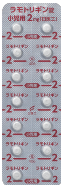
ラモトリギン錠小児用2mg「日医工」