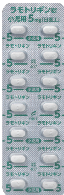
ラモトリギン錠小児用5mg「日医工」