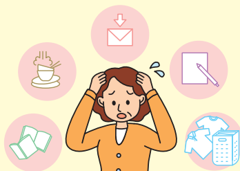
● 考えが まとまらない