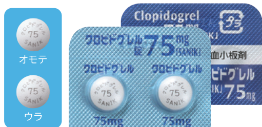
クロピドグレル錠75mg「SANIK」