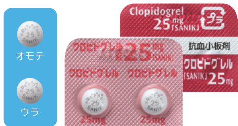
クロピドグレル錠25mg「SANIK」