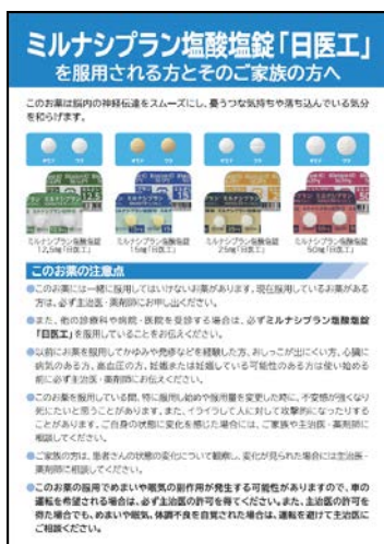
A5 版 本剤服用時の注意事項全般

本剤服用時の注意事項を記載した患者さん向け指導箋をご用意しておりますので、患者さんへのご説明の際にご活用いただきますようお願い申し上げます。