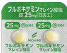
フルボキサミンマレイン酸塩錠 25mg「日医工」