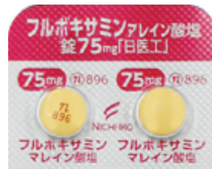
フルボキサミンマレイン酸塩錠 75mg「日医工」