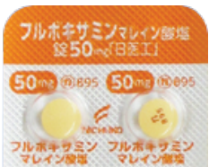
フルボキサミンマレイン酸塩錠 50mg「日医工」