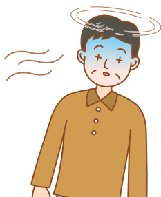
意識の 低下・消失