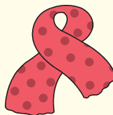
スカーフやマフラー