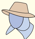
首筋にカバーの付いた帽子