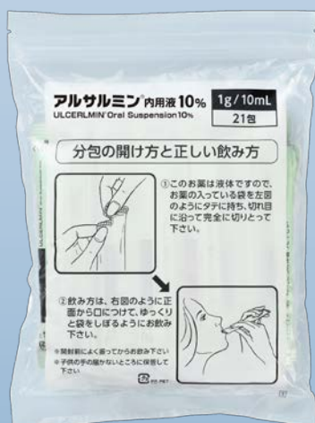
【10mL×21包入りチャック袋】