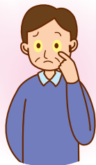
皮膚や白目が 黄色くなる