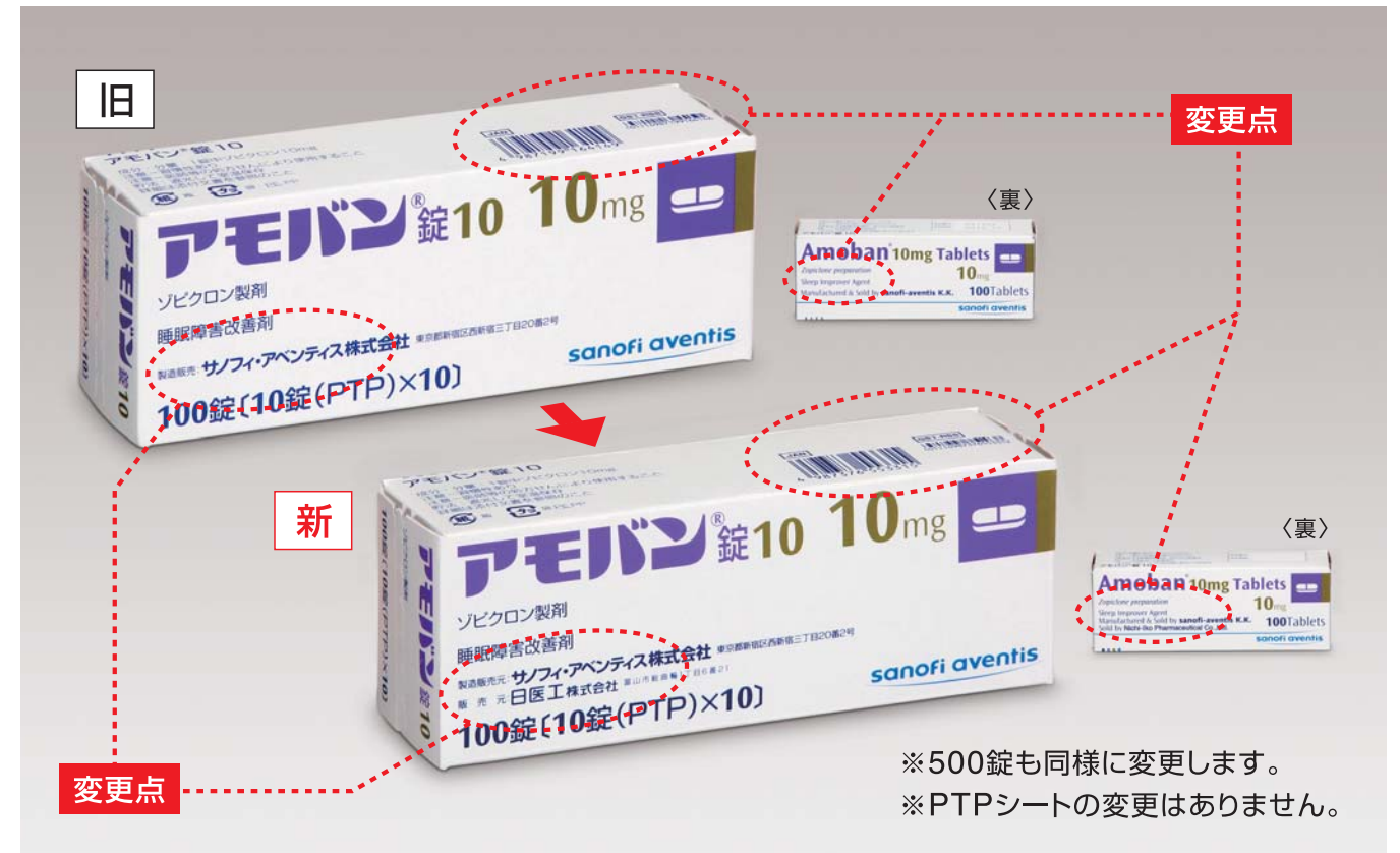
外箱表示の変更点