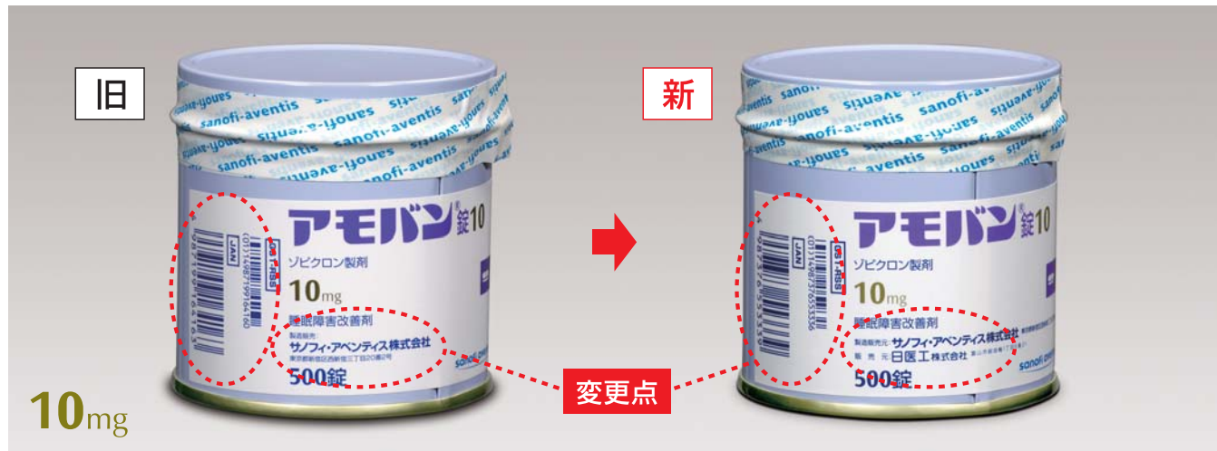
外箱表示の変更点