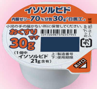
イソソルビド内服ゼリー 70%分包30g「日医工」