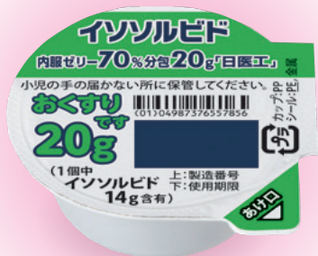
イソソルビド内服ゼリー 70%分包20g「日医工」