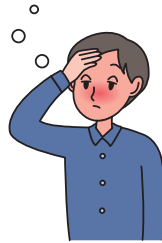
風邪のような症状