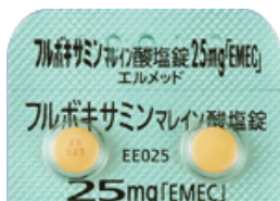
フルボキサミンマレイン酸塩錠 25mg「EMEC」