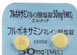
フルボキサミンマレイン酸塩錠 50mg「EMEC」