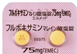
フルボキサミンマレイン酸塩錠 75mg「EMEC」