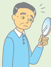
皮膚や白目が 黄色くなる