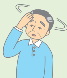
気を失う、 意識がなくなる