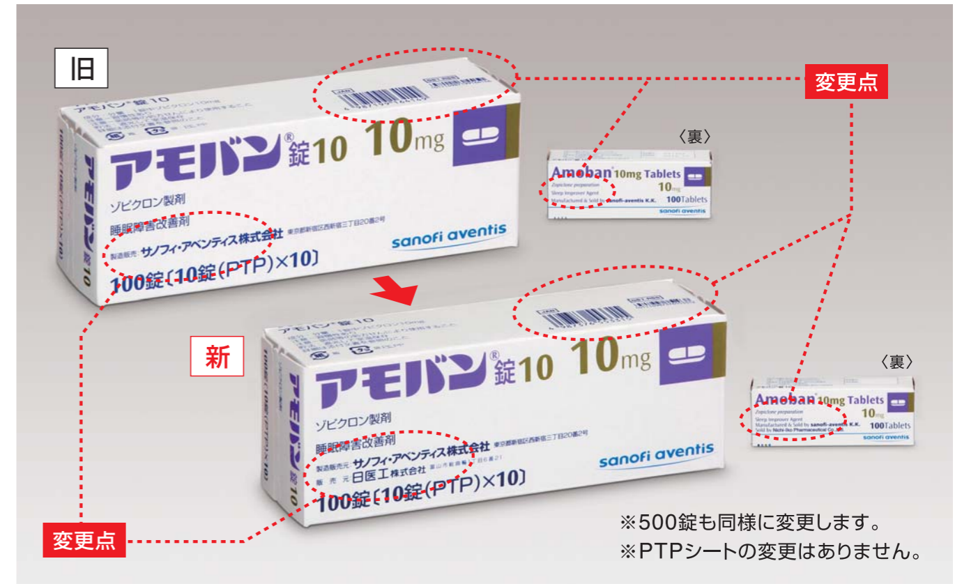
外箱表示の変更点