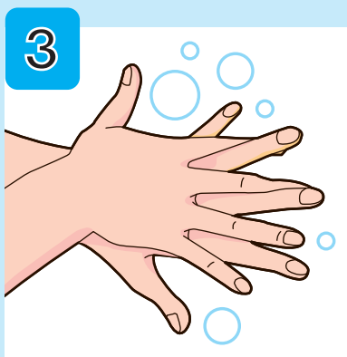
手の甲をもう片方の 手のひらでこすり洗う