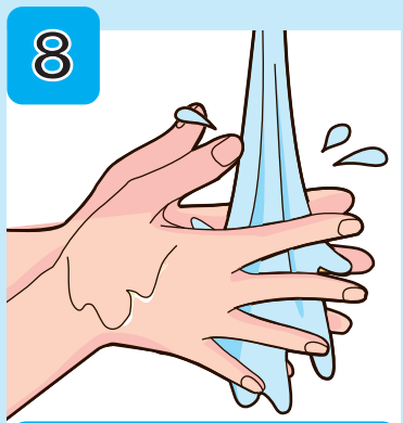
流水でよくすすぐ