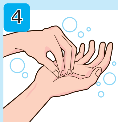
指先と爪をもう片方の 手のひらでこすり洗う