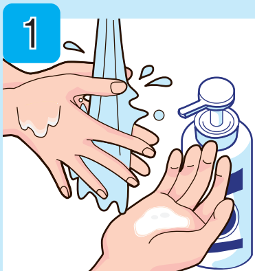
流水で手をぬらして せっけんを手にとる