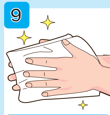
ペーパータオルなどで 水分を拭きとる