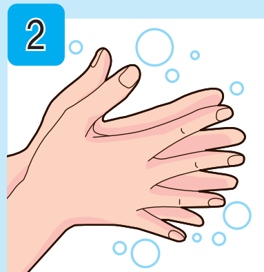
手のひらを合わせて よく洗う